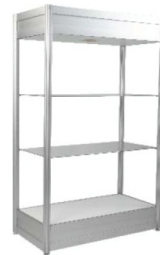
Présentoir vitrine Showcase 40" x 20" x 80"H 20" de large aussi disponible / 20" wide also available