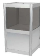
Boîte de tirage Raffle Box 18.5" x 18.5" x 40"H