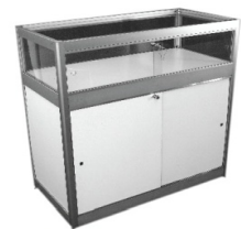
Comptoir vitrine Showcase counter 40" x 20" x 40"H