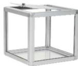
Boîte de tirage pour table Raffle cube for table 12" x 12" x 12"H