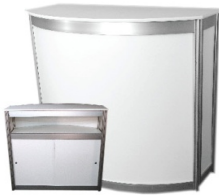
Comptoir courbé, portes coulissantes Curved counter with sliding doors 40" x 32" X 40"H