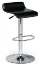
Tabouret Alice Alice Stool