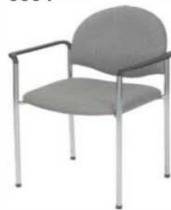
Fauteuil tissu gris Armchair grey fabric