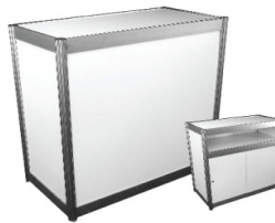
Comptoir, portes coulissantes Counter with sliding doors 40" x 20" x 40"H