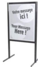
Porte affiche Sign holder 60" H