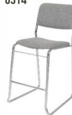
Tabouret tissu gris High stool grey fabric