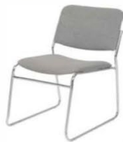
Chaise tissu gris Side chair grey fabric