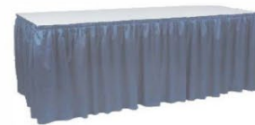
Table avec jupe Draped table 72" x 24" x 30"H Table avec jupe Draped table 48" x 24" x 30"H

Disponible 42" haut / Available 42" high