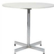
Table Table 30" x 30"H