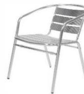
Fauteuil aluminium Aluminium armchair