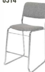
Tabouret tissu gris High stool grey fabric