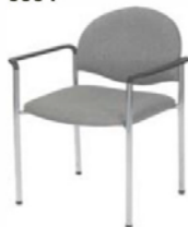
Fauteuil tissu gris Armchair grey fabric