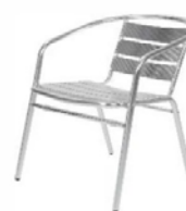
Fauteuil aluminium Aluminium armchair