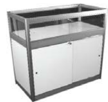
Comptoir vitrine Showcase counter 40" x 20" x 40"H