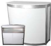
Comptoir courbé, portes coulissantes Curved counter with sliding doors 40" x 32" X 40"H