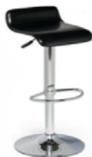
Tabouret Alice Alice Stool