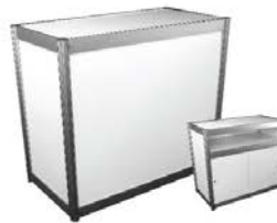
Comptoir, portes coulissantes Counter with sliding doors 40" x 20" x 40"H