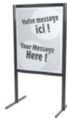
Porte affiche Sign holder 60" H