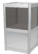
Boîte de tirage Raffle Box 18.5" x 18.5" x 40"H