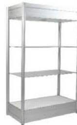
Présentoir vitrine Showcase 40" x 20" x 80"H 20" de large aussi disponible / 20" wide also available