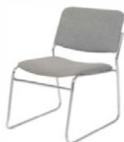
Chaise tissu gris Side chair grey fabric