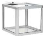
Boîte de tirage pour table Raffle cube for table 12" x 12" x 12"H