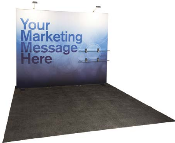
10' x 10' ft. unit unité 10' x 10'