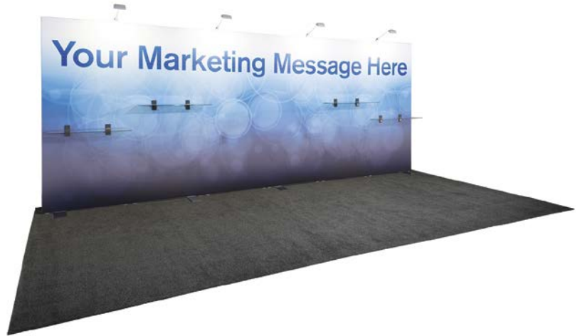
10' x 20' ft. unit unité 10' x 20'