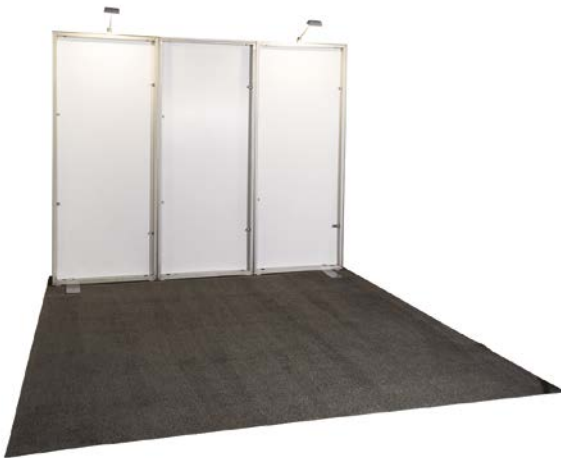
10' x 10' ft. frame cadre 10' x 10'

Cette option est disponible pour les clients qui ont précédemment loué un stand SmartFabric™ et réutilisent maintenant leurs graphiques. Les tissus d'autres sources ne seront pas installés sur ce cadre de location Freeman. Si vous avez besoin que Freeman crée un nouveau graphique, sélectionne la location de stand SmartFabric™. Aucun graphique en tissu ne sera fourni sans la location du cadre.