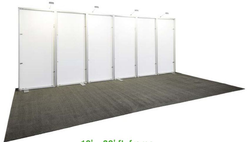
10' x 20' ft. frame cadre 10' x 20'