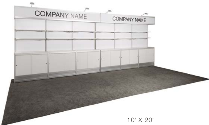
10' X 20'