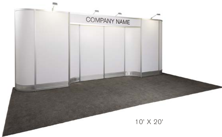
10' X 20'