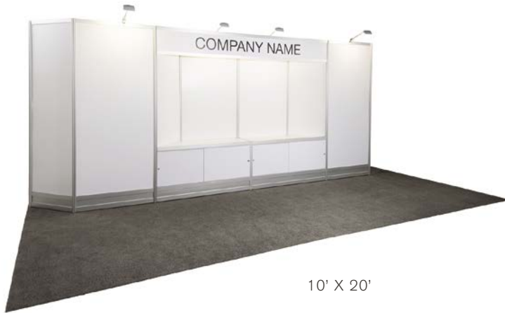
10' X 20'