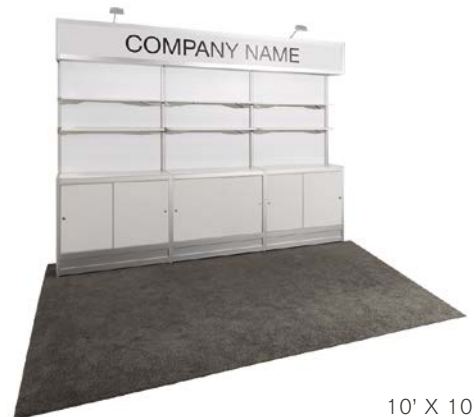
10' X 10'