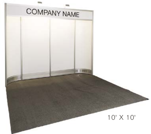
10' X 10'