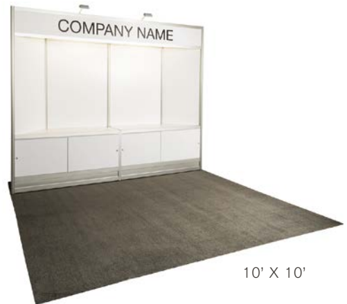
10' X 10'