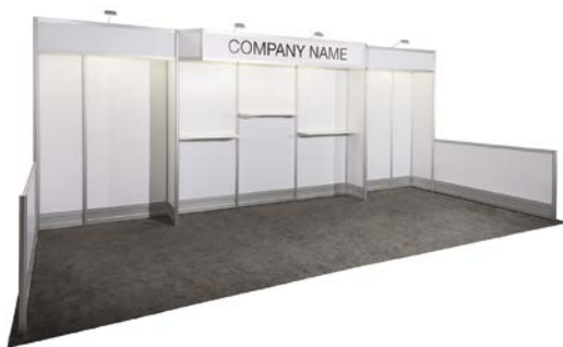
10' X 20'