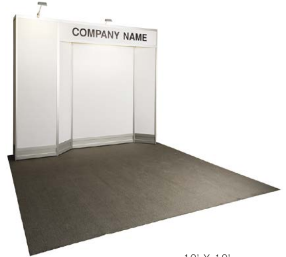
10' X 10'