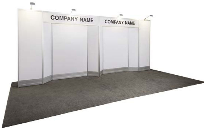
10' X 20'