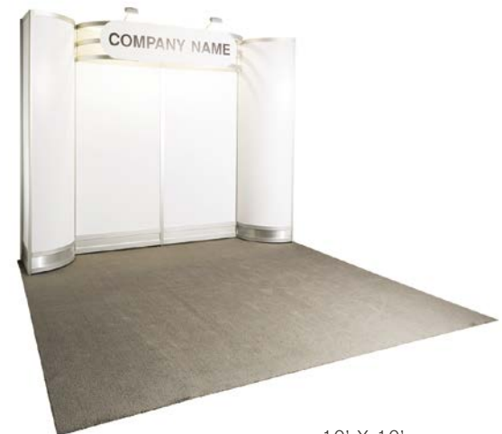
10' X 10'