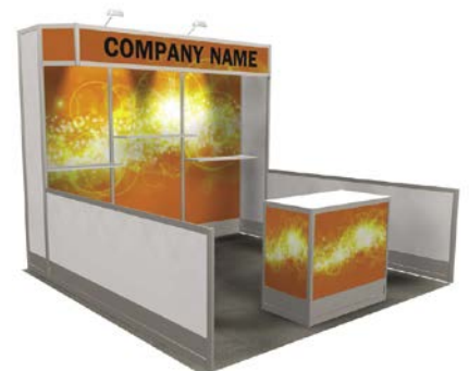
10' X 10'