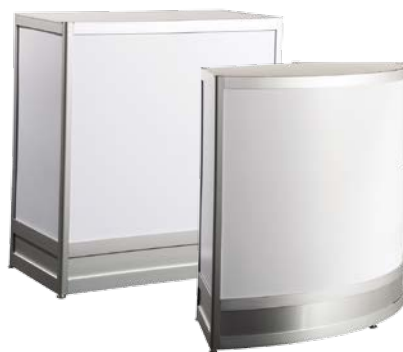
CABINETS | CABINETS