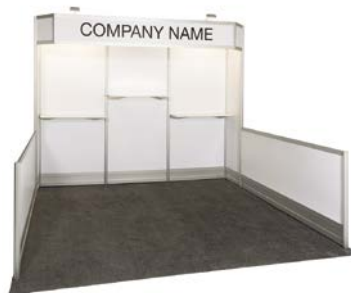
10' X 10'