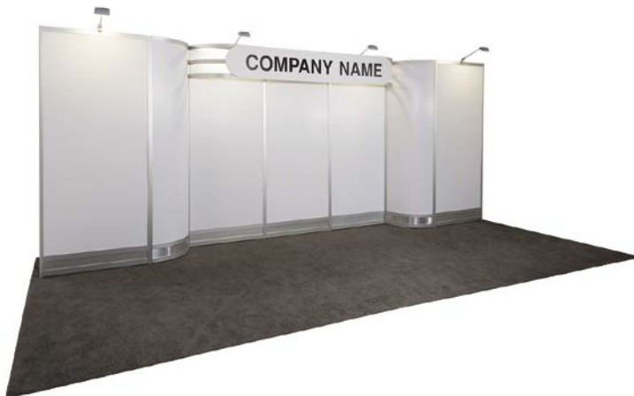
10' X 20'